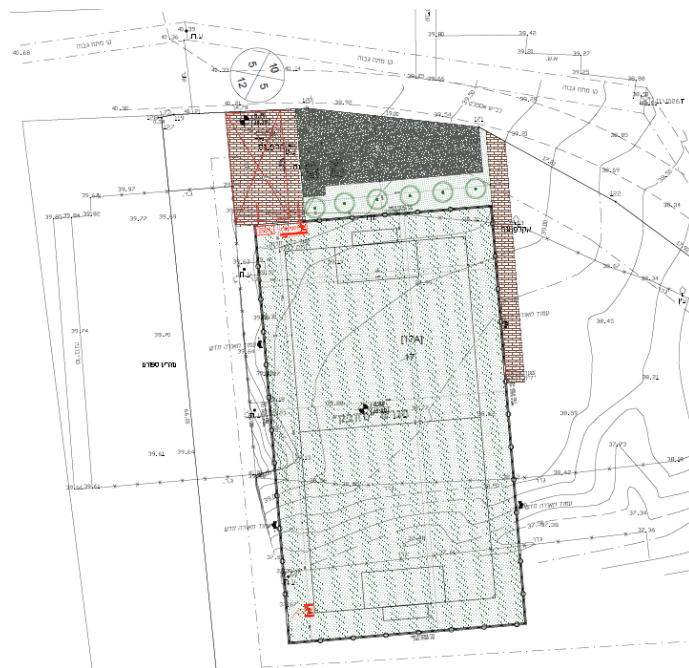
ציור מס' 1.3: מיקום המבנה המוצע – מגרש ספורט חדש, כפר חיטים

במסגרת העבודה הנוכחית, נערכו מספר סיורים לצורך אפיון חזותי וראשוני של סוג הקרקע הקיימת בסביבת הפרויקט.