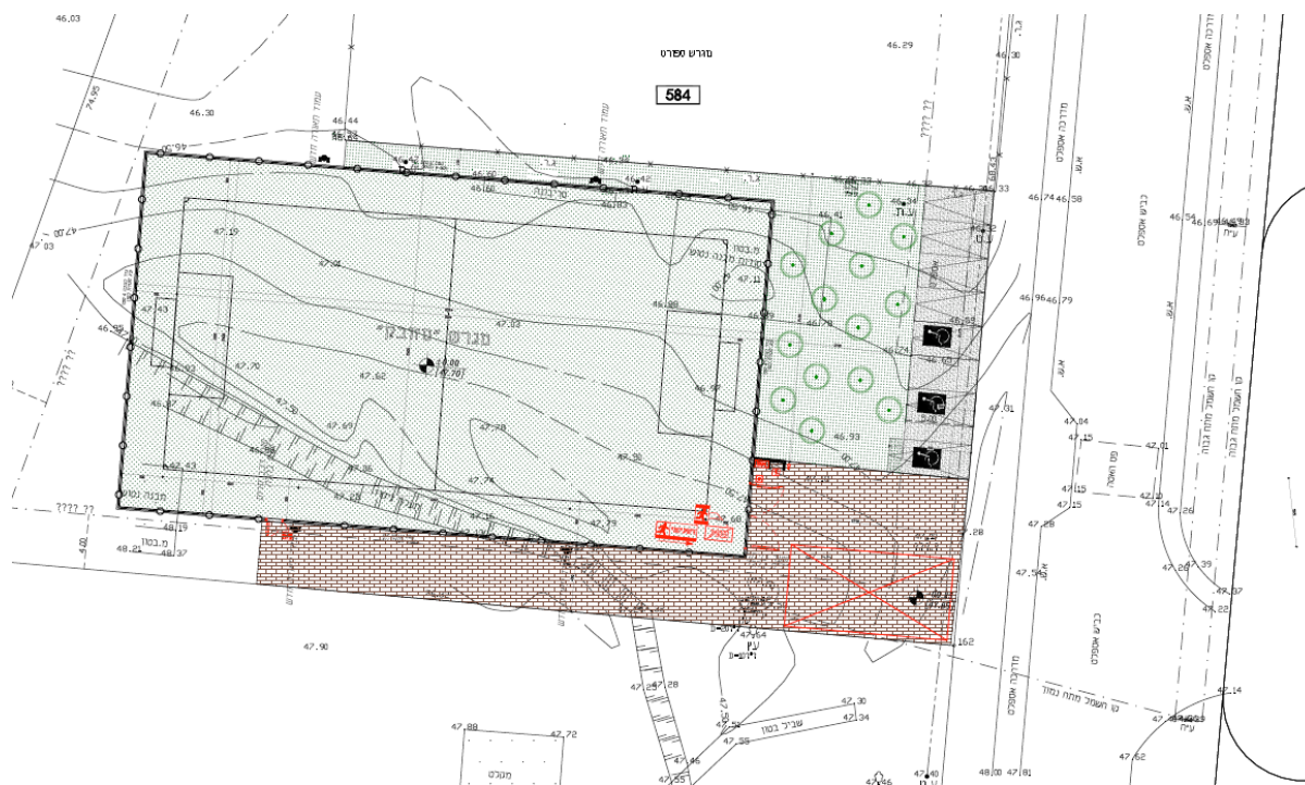
ציור מס' 1.3: מיקום המבנה המוצע – מגרש ספורט חדש, כפר זיתים

במסגרת העבודה הנוכחית, נערכו מספר סיורים לצורך אפיון חזותי וראשוני של סוג הקרקע הקיימת בסביבת הפרויקט.