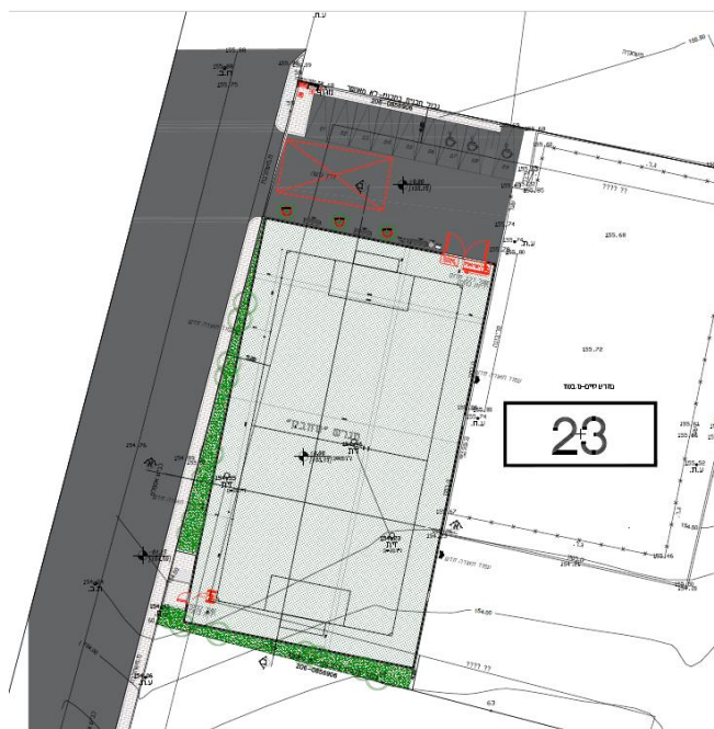
ציור מס' 1.3: מיקום המבנה המוצע – מגרש ספורט חדש, שדמות דבורה

במסגרת העבודה הנוכחית, נערכו מספר סיורים לצורך אפיון חזותי וראשוני של סוג הקרקע הקיימת בסביבת הפרויקט.